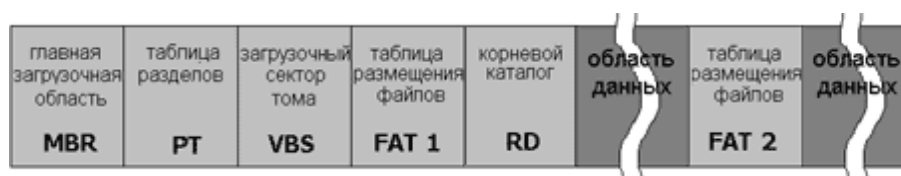
Рис. 2. Структура FAT

Таким образом, схематично FAT можно представить в виде: